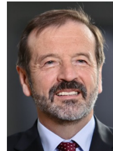
Karl-Heinz Schulz Mandelkern Marketing & Kommunikation GmbH

+49 (2232) 56 86 57 beratung@jaekel-schmidt.de